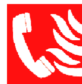
Pohotovostní požární telefon