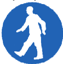
Pěší musí použít tuto cestu

bílý piktogram na modrém pozadí (modrá část zaujímá alespoň 50 % plochy značky).