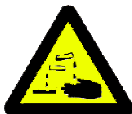
Riziko koroze a poleptání