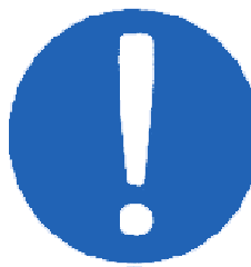
Obecná příkazová značka (ke které se v případě nutnosti připojí jiná značka)