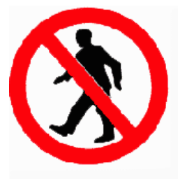
Průchod pro pěší zakázán