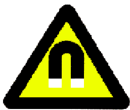
Silné magnetické pole