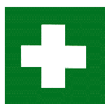
Místo první pomoci