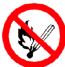
Zákaz kouření a použití otevřeného ohně