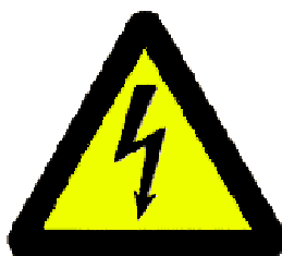
Nebezpečí; elektrický proud