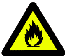
Požárně nebezpečné látky nebo vysoká teplota 1)